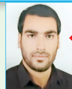
به کوشش: مهندس مجتبی تن زاده