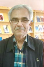
به کوشش: عبدالحسین احمدی ریشهری