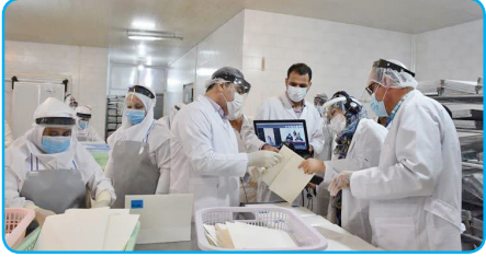
مدیر کل دامپزشکی استان بوشهر خیر داد: بازدید ویدیویی از عمل آوری فرآورده‌های خام دامی در بوشهر

معاون اداری و مالی و مدیریت منابع انسانی دانشگاه فنی و حرفه ای کشور: