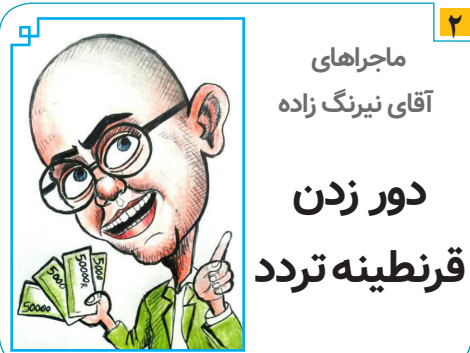
ماجرای آقای نیرنگ زاده دور زدن قرنطینه تردد