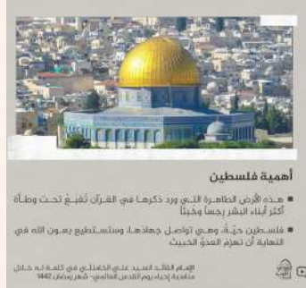
امیهة فلسطین • کتبه قرآنی انحصاری الفی رود دکوما فی القریة العتیة تحت وصفا • کتبه لیلہ الفجر ریضا وادنا • فلسطین جزا، وصی نورعزل دوحدها ویتلکاتبع بعون الله • تخلیة ان تعزیر لعمد الخلیف

مترجم: امان الله حسینی (مهندس شیمی، کارشناس حقوق)