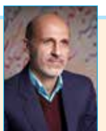
به قلم: وحید حاج سعیدی (روزنامه نگار و طنز پرداز)

در شماره قبل به اختصار در مورد کم رویی و خجالتی بودن کودکان صحبت کردیم بخشی از عوامل و علت های این موضوع را بررسی کردیم چرایی و چگونگی کم رویی در فرزند نامان را به صورت مختصر بیان کردیم. در این شماره می خواهیم به صورت کوتاه نکاتی را راجع به راه حل های موجود برای رفع این موضوع یا کمتر شدن آن بیان کنیم. یکی از راه کارهایی که والدین باید انجام دهند تا مشکلات ناشی از کم رویی رفع شود این است که کودک را در جمع یا حتی در خلوت تحقیر یا سرزنش نکنند و بخاطر اشتباهی کل شخصیت او را زیر سوال نبرند و به او بفهمانند که کار و رفتار او مناسب نبوده است نه کل شخصیت او.