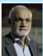
به قلم: عبدالباقی صداقت (روزنامه نگار)

ساحل و پارک ها را نیز به همراه دارد از مسئولین ذریعت در خواست میگردد جهت حل این مشکل و مشکلات مشابه در سطح شهر اقدامات لازم را مبذول داشته و طی یک زمانبندی سریع وبا در نظر گرفتن اعتبار و بودجه مورد نیاز مسیر کانالهای فاضلاب منتهی به دریا را به خطوط اصلی فاضلاب شهری هدایت نمایند.