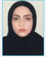
به قلم: زهرا امیر محمدی (کارشناس ارشد علوم اجتماعی)

پدیده کودکان کار مشکلی اجتماعی است که از دیرباز وجود داشته و در دهه های اخیر افزایش یافته است که از دغدغه و معضلات جامعه به حساب می آید. کودکان به عنوان مهم ترین نیروی انسانی آینده جامعه، باید به درستی تربیت و آموزش ببینند و خانواده نقش بسیار مهمی در زندگی کودک دارد چرا که تجربه های اولیه زندگی شان در خانواده شکل می گیرد. و کودکان کاری که از نگاه هادور مانده اند کودکان بدسپرستی هستند که به علت شرایط نابسمان خانوادگی، قربانی فقر شده و برای کسب درآمد همان کودکی پدر دنیای بزرگسالی گذاشته اند و به جای اینکه از دنیای کودکی شان لذت ببرند و سرگرم بازی و مهارت آموزی باشند درگیر فعالیت های اقتصادی شده که این فعالیت های زود هنگام آن ها را غرق در آسیب های اجتماعی می کند. و کودکان بدسپرست بر خلاف کودکان خیالی، دارای پدر و مادری می باشند که به دلیل شرایط بد اقتصادی، اعتیاد، طلاق و... صلاحیت لازم برای نگهداری از کودکان را ندارند و آسیب های وارد شده بر این کودکان تاثیر مستقیمی