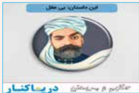
به قلم: سید محمد شاهزاده صوفی (روزنامه‌نگار)

این داستان: جمله ای با عقل! حکیمی را گفتند با واژه عقل جمله ای ساز. فرمود: در یونجه زار الاغی را بدیدم سخت گرسنه که به دهی میرفت. گفتند اینکه عقل نداشت. فرمود: اگر داشت که نمی‌رفت