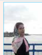
به قلم: زهرا اسدی (آناژ) (روزنامه نگار)

حاضر با وجود جریان داشتن امور اقتصادی و داد و ستد در بازار وکیل، روح اصلی بازار حفظ شده است. اما قسمت‌های مختلف بازار با نام‌هایی مثل بازار وکیل جنوبی و بازار روح‌الله روی تابلوهای راهنما نشان داده شده است. معماری بازار وکیل بنای بازار از جنس گچ، آجر و آهک ساخته شده است و ستون‌هایی از جنس سنگ تراشیده، ساختمان آن را به یکی از مستحکم‌ترین بناهای عهد خود تبدیل کرده است. سقف چهارسوق بازار بیش از این ارتفاعی در حدود ۱۱ متر داشت که هم اکنون به دلیل خاکریزی کف بازار ارتفاع آن به ۱۰ متر کاهش پیدا کرده است. این سقف چهاربازار منشعب می‌شود. پیش از این زیر سقف چهارسوق بازار حوض مرمرین بزرگی قرار داشت و آب آن از یک آبراه تأمین می‌شد. در حال حاضر حوض مرمرین به دلیل بالا آمدن سطح بازار از بین رفته است. اما آبراه همچنان وجود دارد.