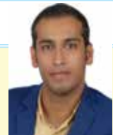
به قلم: مهدی دهقانی (حقوقدان)

ورود جامعه محلی به مدیریت مشارکتی آب زیرزمینی به صورت خودجوش به ندرت اتفاق می‌افتد و عموماً لازم است زمینه‌های تحقق آن به وسیله دستگاه‌های دولتی ذریبط (یا به وسیله سازمانهای مردم نهاد تحت پشتیبانی و نظارت دولت