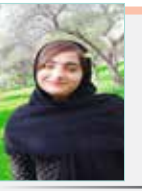
به قلم: آیدا عالی پور (مشورل سایت نشریه دریا کنار)

سربینه حمام یک هشت‌ضلعی منظم است که هشت ستون یک‌پارچه سنگی در وسط سقفی گنبدی قرار گرفته‌اند. گرم‌خانه با سنگ‌فرش پوشیده شده است اما جالب توجه این است که در زیر این سنگ‌فرش دالان‌های کم‌عرض و باریکی ساخته شده که هوای گرم و بخار آب در آن جریان می‌یافته است تا کف حمام زودتر گرم شود. در جنوب گرم خانه، خزینه قرار دارد که دو دیگ بزرگ برای گرم کردن آب