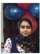
به قلم: مریم یوسفی (روزنامه نگار)

تعریف انجمن صنفی کارگری: در اجرای ماده ۱۳۱ قانون کار، به منظور حفظ حقوق و منافع مشروع و قانونی و بهبود وضع