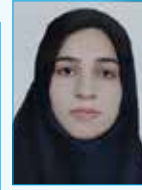
مصاحبه‌گر: فاطمه نژاد حسینی