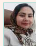
به قلم: الهام میرزائی زاده (مدیر دفتر سرپرستی)

رسمی، پیمانکار قراردادی - پیمانکار شرکتی ( می باشد در این طبقه بندی نیروهای پیمانکاری زیر فشار تبعیض و ناملایمات ها در حال له شدن هستند و هیچ نظارتی در کار نیست آقای وزیر نفت نیروهای پیمانکار را میشناسید؟ آگاه به وضعیتشان هستید؟ آیا این همه تبعیض به جرم عوامل پیمان بودن رواست ۲۵ مهرماه ۱۴۰۰ یکی از این نیروهای عوامل پیمان خود را به دار آویخت انگیزه خودکشی مشکلات مالی و تبعیض ها بیان شد جناب وزیر، وقت آن رسیده پای به میدان بگذارید و به داد این نیروها برسید و نگذارید جوانانمان که این حجم از گرما و آلودگی را تحمل می کنند دغدغه مالی هم داشته باشند