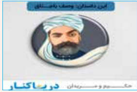
به قلم: سید محمد شاهزاده صفوی (روزنامه‌نگار)

این داستان: وصف باجناق حکیمی را گفتند در وصف باجناق شعری بسرا. حکیم گفت: همانکه رویش سیاه همچون کلاغ است تنش بی سایه و نامش باجناق است گفتند این که قافیه نداشت. فرمود: حقیقت که داشت.