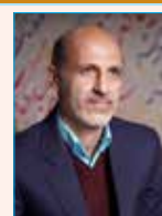
به قلم: وحید حاج سعیدی (روزنامه نگار و طنز پرداز)

خبری تجلیل به عمل آمد. شایان ذکر است وحید حاج سعیدی روزنامه نگار گلستانی نیز در بخش طنز مکتوب حایز رتبه اول گردید