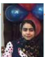
به قلم: مریم یوسفی (روزنامه نگار)

مرمت قرار گرفت. با قدم زدن در این بنای فوق العاده می توانید به خوبی تاریخ یک قرن پیش را لمس کرده و از نزدیک مشاهده کنید.