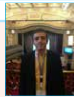
به قلم: دکتر علی شرف احمدیان (مدرس دانشگاه)

اهمیت کارآفرینی و اثرگذاری آن بر رشد تولید اشتغال و حتی از زوایای برتری کشور بررسی پوشیده نیست