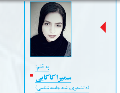
به قلم: امیر اکابری (دانشجوی رشته جامعه شناسی)

بازار سنتی کرمانشاه یک مرکز تجاری در شهر کرمانشاه است. این بازار در زمان خود یکی از طولانی ترین بازارهای سرپوشیده در خاورمیانه به شمار می آمده است. ساختمان بازار دارای تویزه های منحصر به فرد است. این اثر در تاریخ ۱ دی ۱۳۷۶ با شماره ثبت ۱۹۴۴ به عنوان یکی از آثار ملی ایران به ثبت رسیده است.