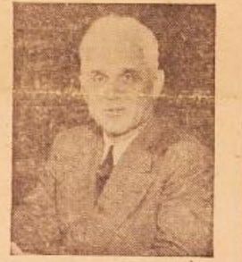
دکتر ویلسن رئیس اداره اطلاعات امریکا وظیفه این اداره آنست که بمبادلات فرهنگ را بین کشورهای مختلف جهان اداره نماید و اطلاعات لازم را مبادله نماید

در شماره های گذشته گفتیم که هلی گویتز موتور بوت سرباز و افسر و پلیس ژاندارم و گارد مسلح نمیتواند جلوی سوداگران و دربانان که بماده کالا از این ورخلیج بآن در خلیج مسعود و دولی ها آنان را قاجاقچی مینامند بگیرد... پس چه باید کرد... سازمان گارد مسلح را که يك سازمان بی مصرف و زائمی است و تنها برای اینست که دولت های گذشته خواسته اند نظامی ها را هم در این خوان بشما شرکت دهند از میان ما داریم و بجای آن پولش و ایوبی را که خرج گارد میکشیم خرج بالا بردن سطح فلاحت و زراعت و خرج موتور سازی ساختن کشاورزی باستانی بقیه در ص ۶