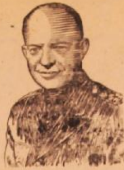
ژنرال دوايت از تهران که در این روزها در آمریکا احتمالی حزب جمهوری خواه امریکا در انتخابات آینده ریاست جمهوری