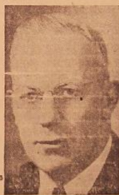
اول وارن استاندار ایالت کالیفرنیا کاندید احتمالی ریاست جمهوری از طرف حزب جمهوریخواه می باشد

دویاکنار در شماره ۳۳-۳۴/۲/۱ صغفه ۲ ستون تحت عنوان (تشکیل سازمان بندر) چنین نوشته بود يك